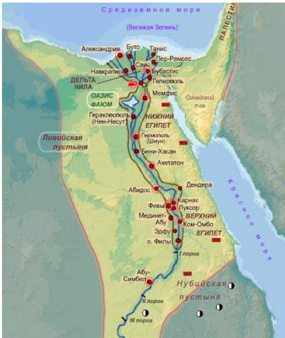
Рис. Карта Древнего Египта