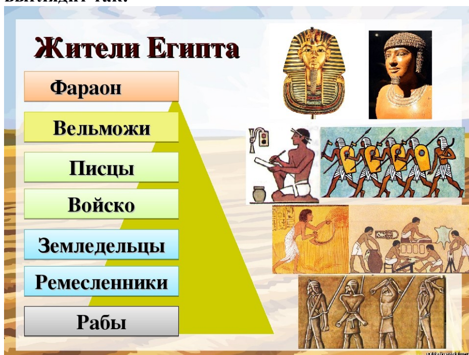
Рис. Структура египетского общества

Социальная структура Древнего Египта в иерархическом порядке выглядит так: